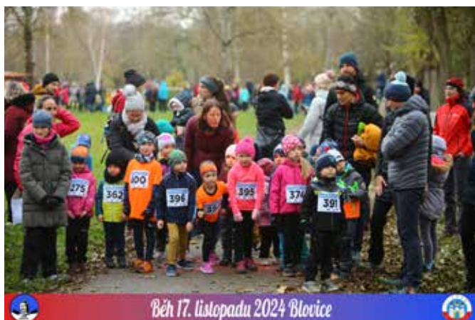
Běh 17. listopadu 2024 Blovice