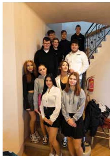
Žáci SŠ a ZŠ Oselce, Blovice na předvánočním setkání seniorů

Pro veřejnost budeme k dispozici do středy 18. 12. 2024. Opět otevřeme v pondělí 6. ledna 2025.