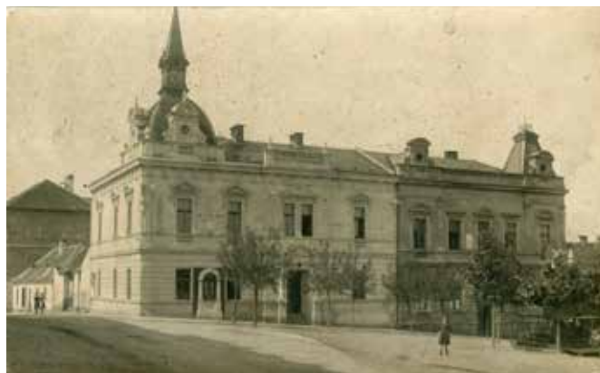
Pohlednice blovické radnice a okresního soudu (vpravo) z 20. let 20. století.

Grossovy literární počiny se datují především do 50. až začátku 60. let 19. století, odpovídajících období jeho studií. Humoristické ladění jeho textů možná také vycházelo z potřeby veřejně publikovat, což však v českých zemích v 50. letech 19. století v atmosféře Bachovského absolutismu a zvýšené míře cenzury nebylo příliš jednoduché a autoři si museli vybírat nezávadnou tematiku. Později se jeho texty objevovaly například v časopise „Právník“. V roce 1872 uveřejnil v rubrice „Praktické příklady“ pojednání „Jaký účinek má mít námitka žalovaného, že mu věřitel slíbil