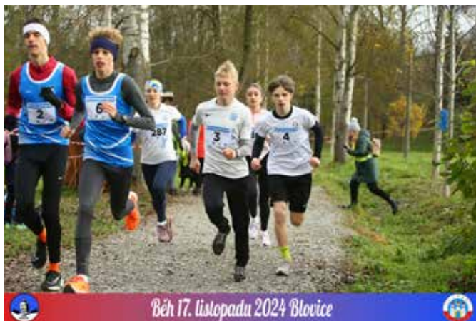
Běh 17. listopadu 2024 Blovice