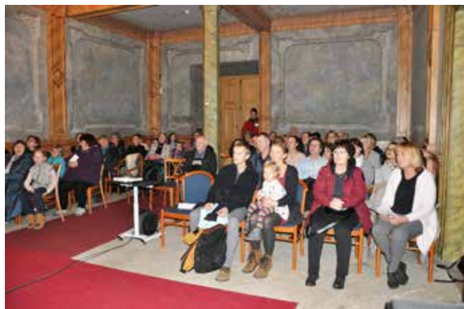
Slavnostní křest nových varhan v Muzeu jižního Plzeňska 8. prosince 2024