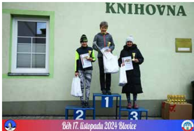
Běh 17. listopadu 2024 Blovice