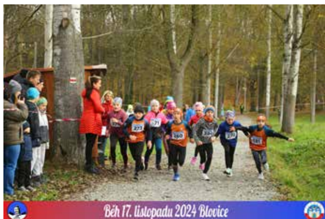
Běh 17. listopadu 2024 Blovice