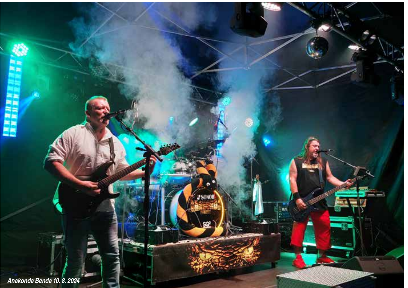
Anakonda Benda 10. 8. 2024