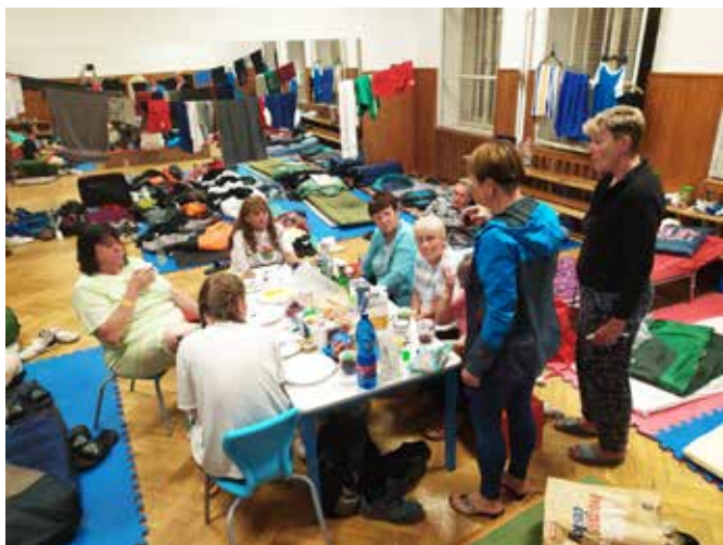
naše království v tělocvičně