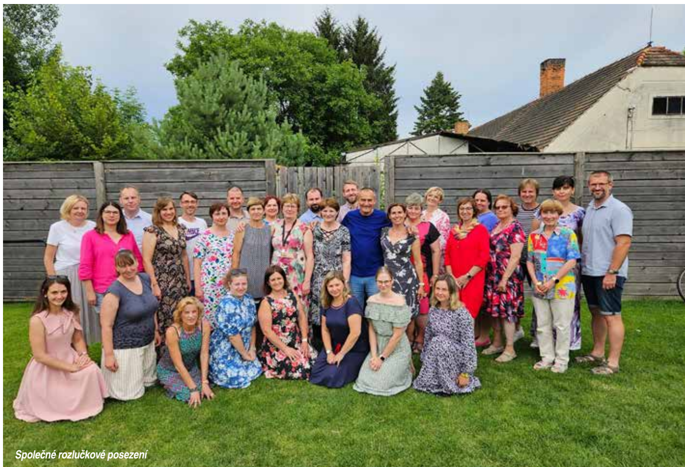
Společné rozlučkové posezení