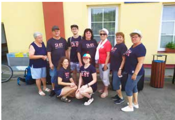
sobotní odjezd do Prahy

Už před polednem v sobotu 29. června vyrazila většina z nich do Plzně, odkud je potom přepravily autobusy do místa ubytování. To jsme měli v základní škole v Botičské ulici pod Vyšehradem. Pan ředitel byl moc milý, vstřícný, přišel se na nás podívat a popřát nám hodně úspěchů při cvičení.