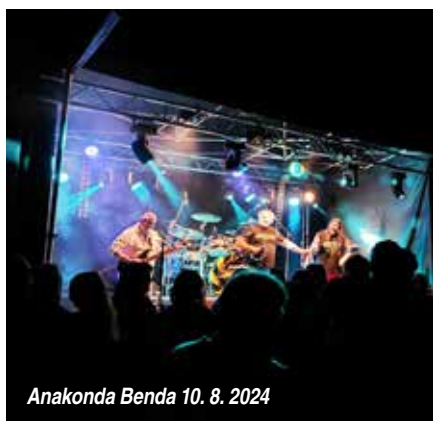
Anakonda Benda 10. 8. 2024