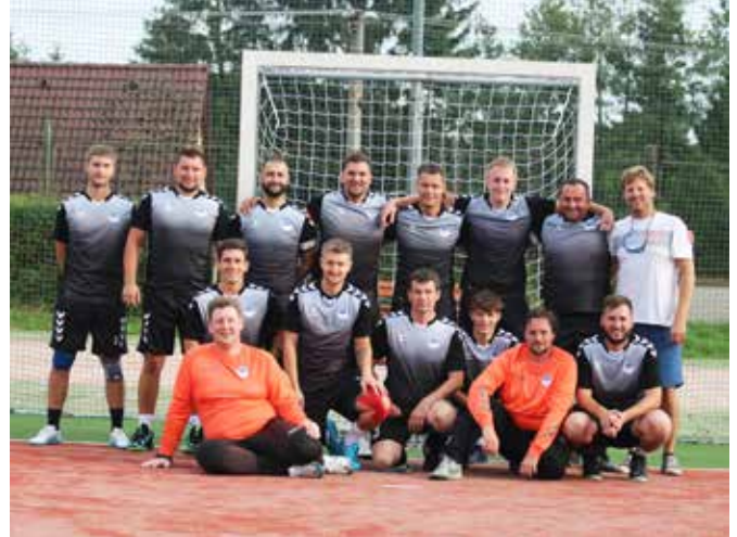
Národní házená – družstvo mužů, které postoupilo do II. ligy