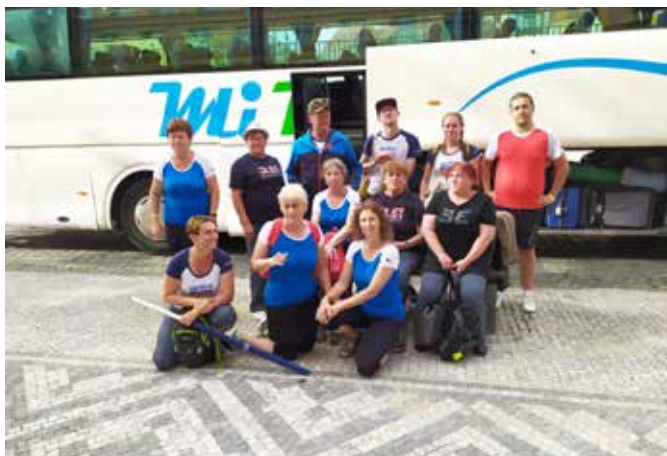
.... už odjíždíme

Se společnými nácviky jsme začali hned v sobotu v podvečer na Královských Vinohradech. Museli jsme se seznámit se samotným závěrem skladby, kdy na ploše vzniknou čtyři malé a jeden velký čtyřlístek. Tohle se nedalo trénovat po částech, na závěrečný obrazec je vždy třeba všech cvičenců. Naši kluci praporečníci měli kromě toho nácvik slavnostního pochodu, který potom předvedli spolu s dalšími více než čtyřiceti členy a členkami Sokolské stráže v zahajovacím průvodu.