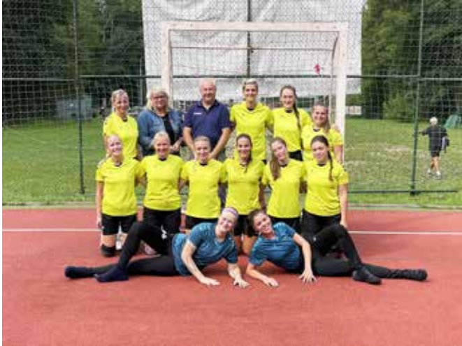
Národní házená – družstvo žen, které hraje I. ligu