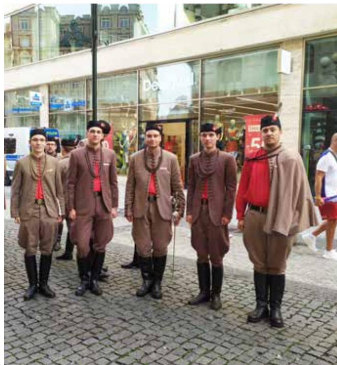
slet Praha 2024

kteří se účastnili slavnostního zahájení 1. programu. Ten se konal ve čtvrtek od 21:00 hodin. V úterý večer proběhlo večerní vystoupení Sokol Gale, ve kterém jsme měli i my nastoupeného svého praporečnicka se slavnostním praporem. Středa už byla ve znamení projížděček programů a hlavně generálky čtvrtého večerního programu. Ten přenášela živě Česká televize. Slavnostního zahájení, při kterém nastoupili praporečníci k ostužkování svých praporů, se zúčastnil starosta ČOS Martin Chlumský a prezident ČR Petr Pavel.