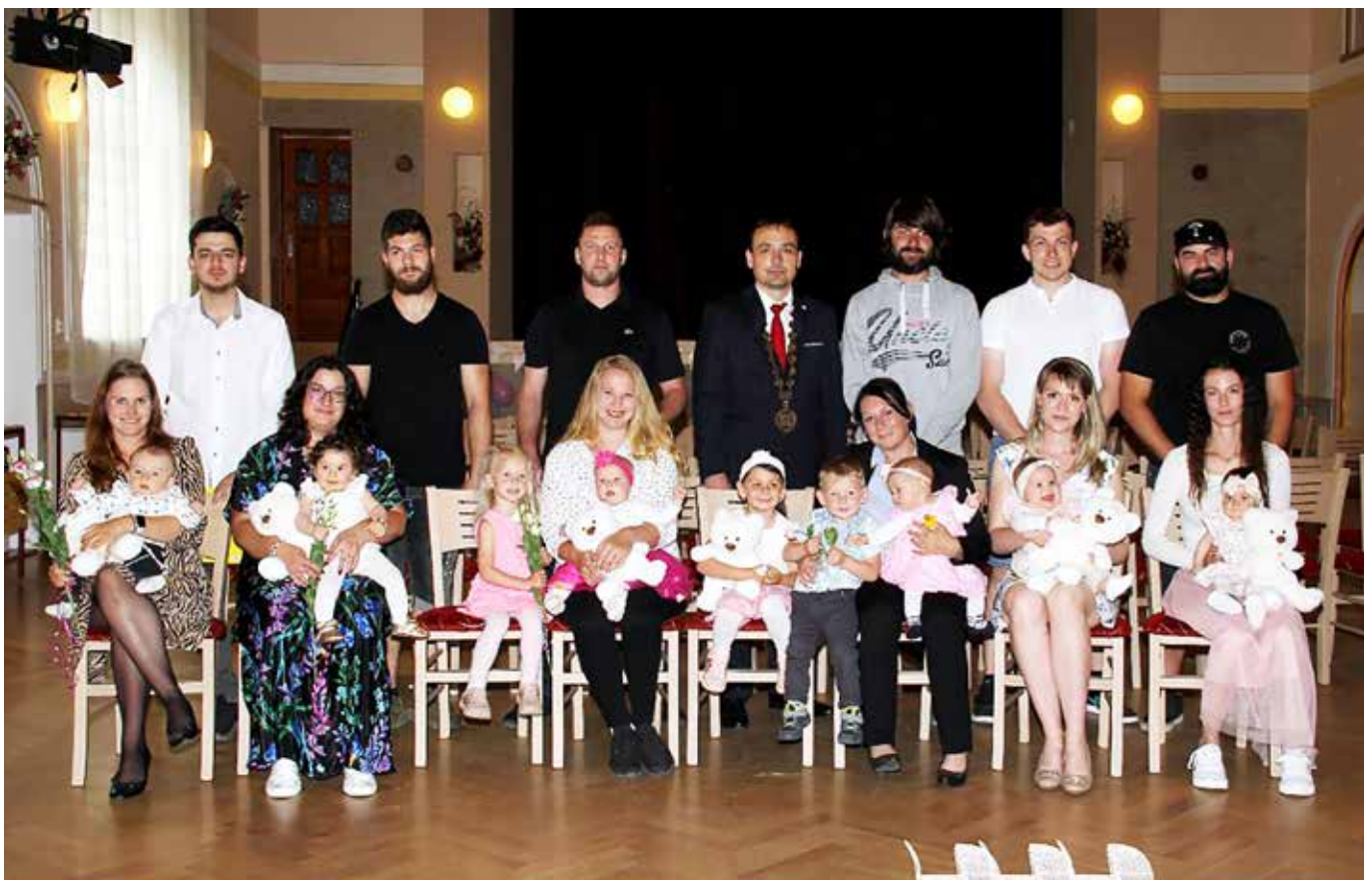
Město Blovice vítá nové občánky 16. máj 2024