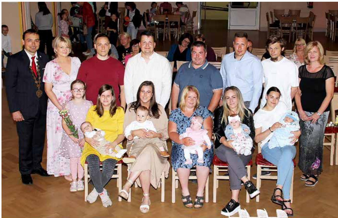
Město Blovice vítá nové občánky 16. máj 2024