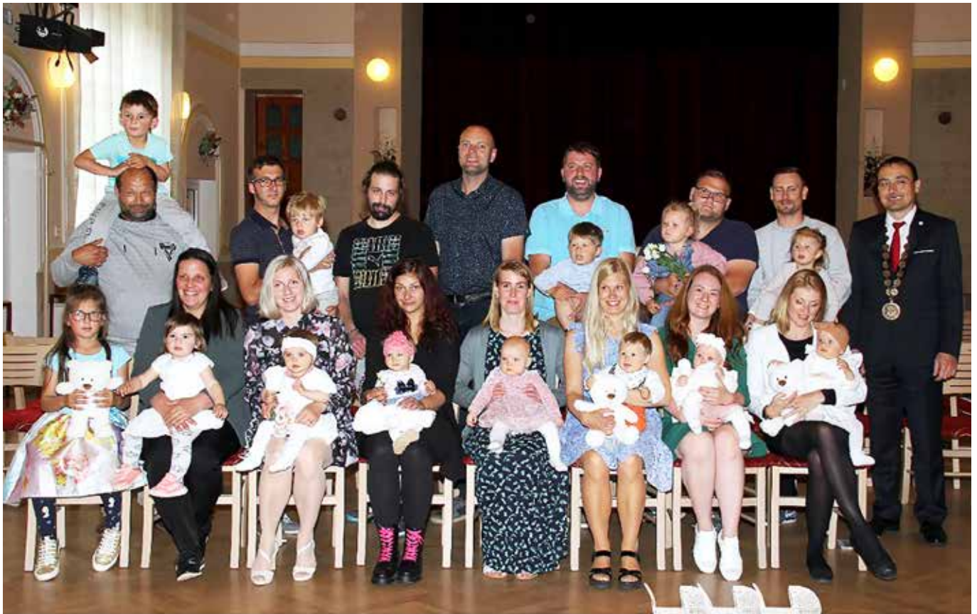
Město Blovice vítá nové občánky 16. máj 2024