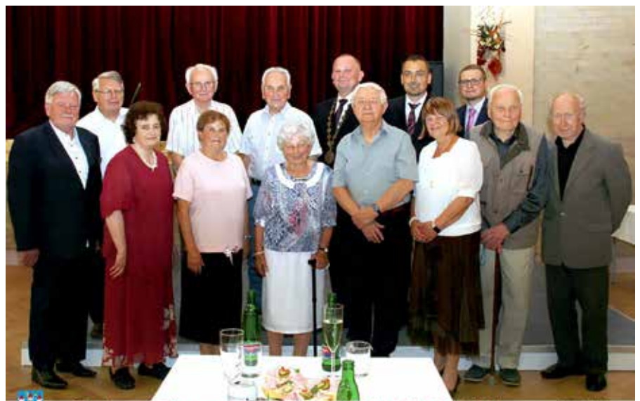
Osobnosti Blovic oceněné u příležitosti 740 let města 19. 6. 2024