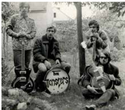
1968 – THE MONSTERS 1