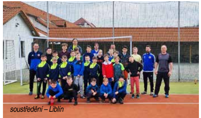
soustředění – Liblín