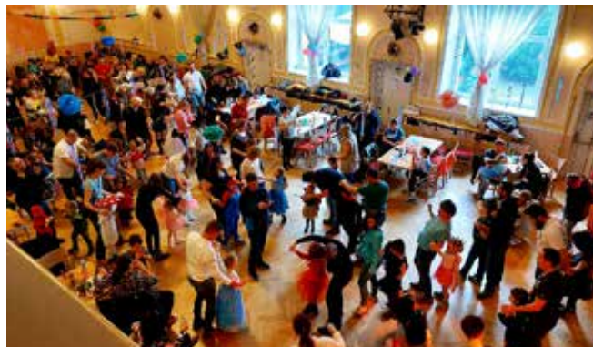
Dětský maškarní den (3. 3. 2024)

Město Blovice a Městské kulturní středisko Blovice srdečně zvou spoluobčany na