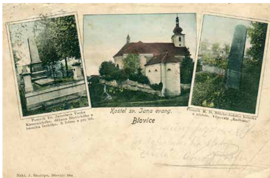
Pohlednice Blovic z roku 1904. Uprostřed pohled na kostel svatého Jana Evangelisty a kapli svatého Kříže s rodinnou hrobkou Krakovských z Kolovrat a Pálffyů de Erdöd, majitelů hradišského panství.