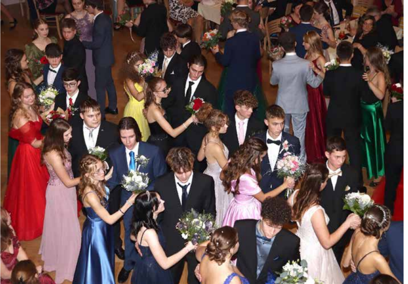
Taneční – Závěrečný ples