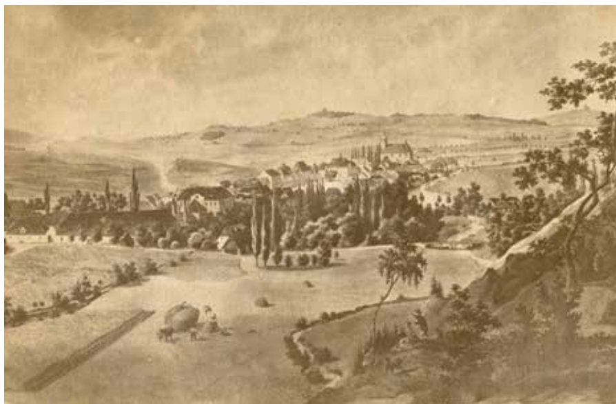
Pohled na Blovice, Hradiště a Bohušov před rokem 1868.

Kovářík, Václav a kol.: Blovice 1284–1984. Blovice 1984.