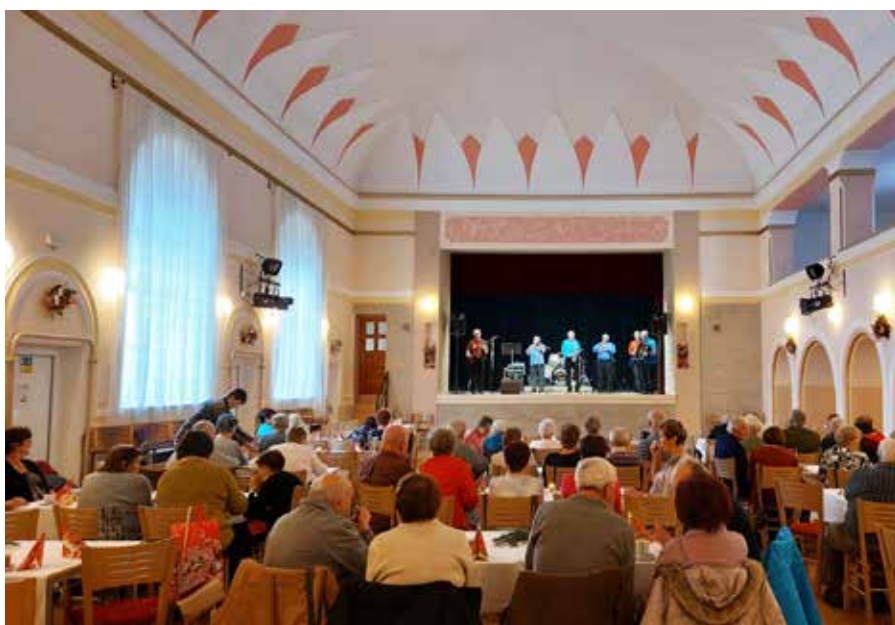
Předvánoční setkání seniorů

MKS LD Blovice pořádá zájezd na muzikál do Hudebního divadla Karlín v Praze.