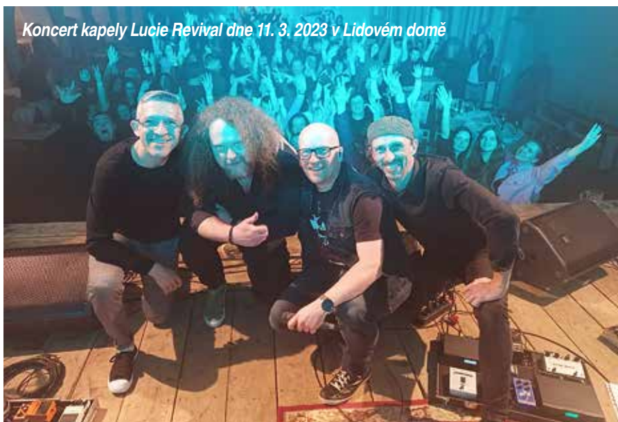
Koncert kapely Lucie Revival dne 11. 3. 2023 v Lidovém domě