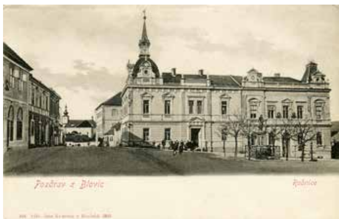
Budova blovické radnice s částí dnešní Americké ulice v roce 1903. Vydáno nákladem Jana Klementa.

Matriky SOA Plzeň. Dostupné na www.portafontium.eu Matriky SOA Praha. Dostupné na https://ebadatna.soapraha.cz Navrátil, Michal: Almanach československých právníků. Praha 1930. I. Jména pp. zakladatelů Matice České. II. Výtah účtů z Matice České. III. Seznam spisův a map. Praha 1891. Časopis Musea Království Českého, Praha 1886. Osobní. Národní politika, r. 9, č. 273, 5. 10. 1891. Ottův slovník naučný. Hédypathie – Hýždě. Hory Kašperské. Praha 1897, s. 650. Ryšánková, Jitka: Vývoj notářství. Diplomová práce. Masarykova univerzita v Brně, Brno 2008.