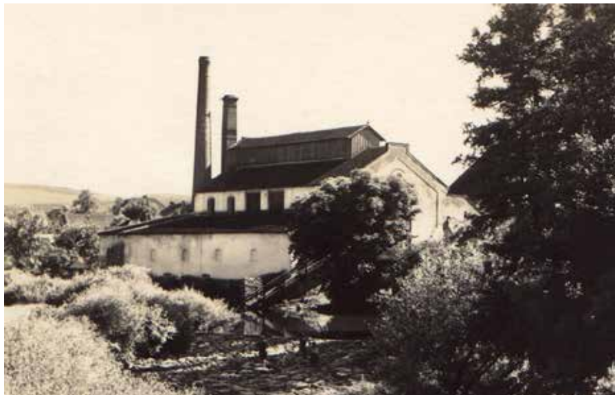
Budova pivovaru od severovýchodu, 1935.