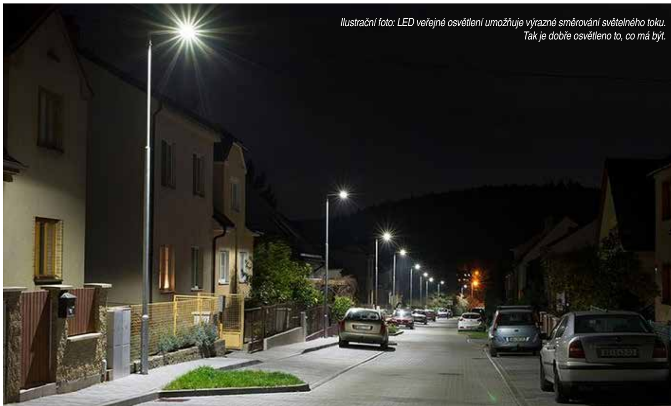
Ilustrační foto: LED veřejné osvětlení umožňuje výrazné směrování světelného toku. Tak je dobře osvětleno to, co má být.