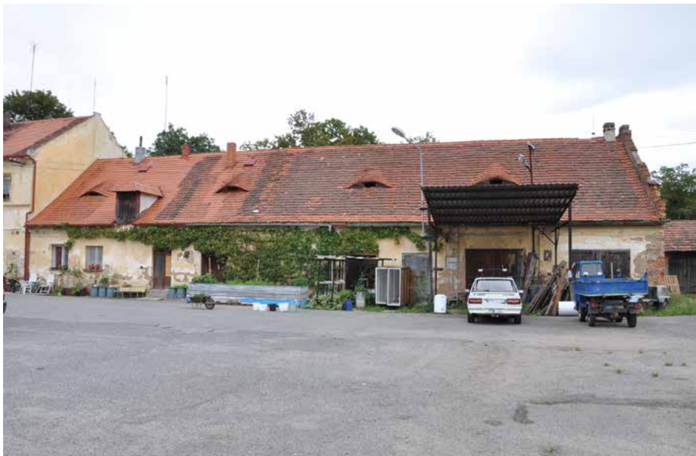
Současná podoba původního objektu pivovaru na Hradišti, 2013.