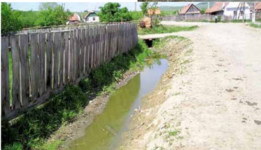
Obr. 1. I v této silně znečištěné kaluži se rozmnožují kuňky žlutobřiché. Jiné prostě už nemají.

Neprůchodnost krajiny. V krajině vznikly četné a účinné bariéry bránící přirozené migraci živočichů, naopak chybějí drobná útočiště, která migraci podporují. Krajina je