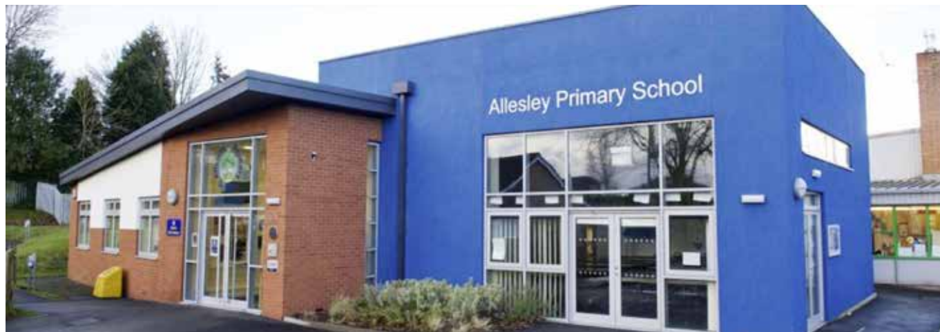
Allesley Primary School v Coventry

Výuka nástrojů po skupinkách má svá mnohá úskalí. Za největší se dá pokládat pomalejší pokrok ve vývoji mladých hudebníků. Tempo lekcí se nezřídka odvíjí od toho nejméně šikovného nebo nejméně připraveného žáka, čímž se rozvoj celé skupiny brzdí. Větší skupiny mají k dispozici 30 a ty menší po 2, dokonce jen 20 minut. Individuální výuka v délce 45 minut, kterou známe a považujeme za samozřejmou z našich ZUŠ, je luxusem, o kterém si malí britští hudebníci mohou nechat zdát, nebo ho draze zaplatit za soukromé vyučování. Další nevýhody jsou organizačního rázu. Často se stává, že ten, či onen zapomene přijít ve smluvený čas a musí se po škole dohledávat, jiný pro změnu zapomene nástroj nebo noty a další minule chyběl, takže se látka musí znovu opakovat. Někdy také bývá problémem neukázněnost, kdy nechota jednotlivce