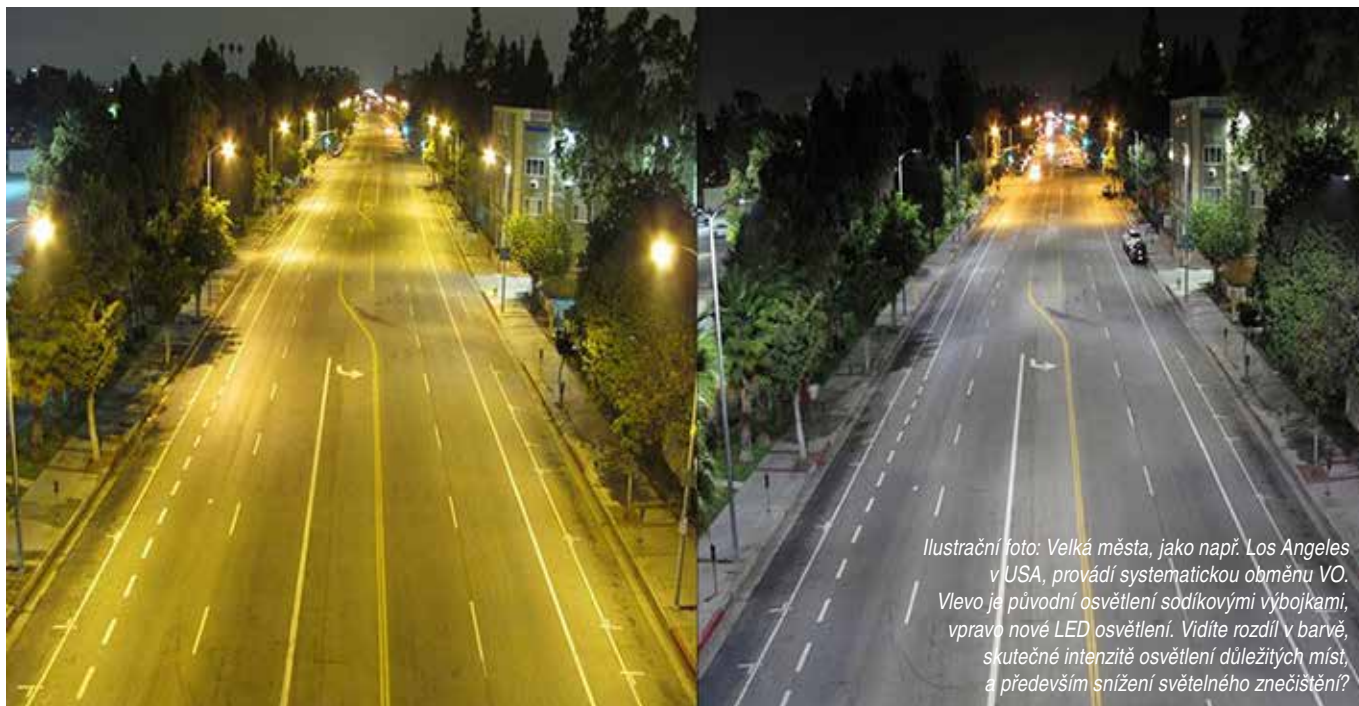
Ilustrační foto: Velká města, jako např. Los Angeles v USA, provádí systematickou obměnu VO. Vlevo je původní osvětlení sodíkovými výbojkami, vpravo nové LED osvětlení. Vidíte rozdíl v barvě, skutečné intenzitě osvětlení důležitých míst, a především snížení světelného znečištění?

Kolektiv autorů, 2017. Jak na chytré veřejné osvětlení – příručka pro města a obce, MŽP, 70 stran Moudrá M. a kol., 2020. Světelné znečištění a příroda. Dostupné z: svetelneznecistení.cz, Citováno dne: 15. 1. 2021