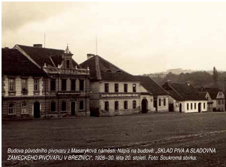
Budova původního pivovaru z Masarykova náměstí. Nápis na budově: „SKLAD PIVA A SLADOVNA ZÁMECKÉHO PIVOVARU V BŘEZNICI“, 1926–30. léta 20. století.