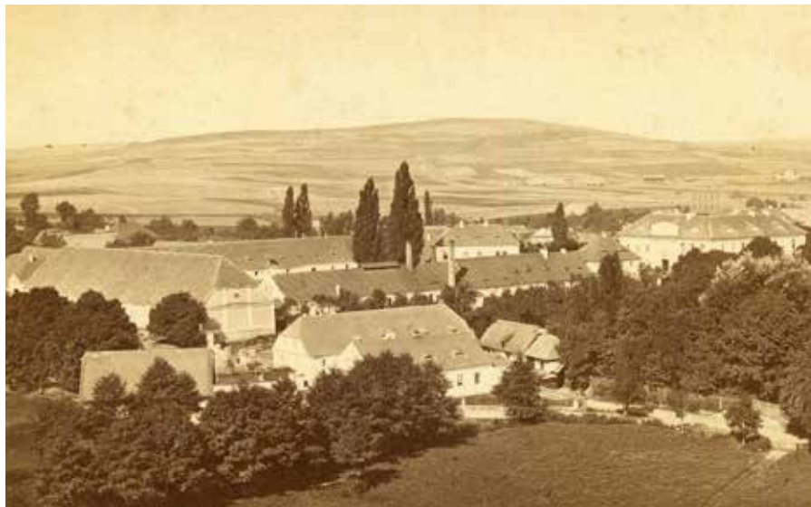
Dvůr a zámek Hradiště – pivovar situován do části s vysokým komínem, přelom 19. a 20. století.