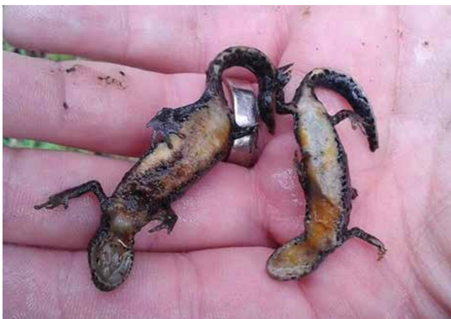
Obr. 4. Dva čolci horští, kteří podlehlí „mločí“ chytridiomykóze.