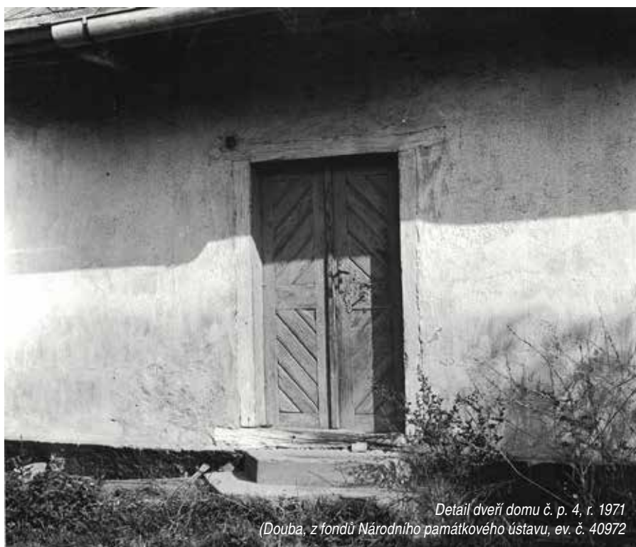
Detail dveří domu č. p. 4, r. 1971 (ev. č. 40972)