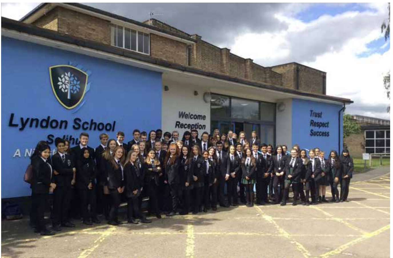
Lyndon School v Solihullu (secondary)