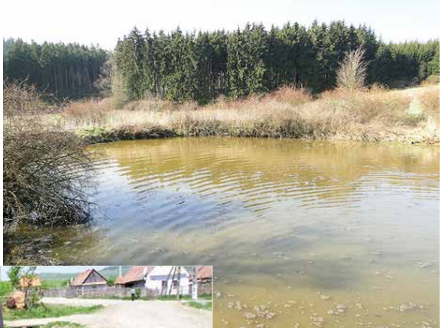
Obr. 2. Silně eutrofizovaný rybník může sloužit reprodukci ropuchám i hnědým skokanům. Vzhledem k přítomnosti silné rybí obsádky je takový rybník pro larvy obojživelníků spíše pastí.

bez ohledu na tzv. mimoprodukční funkce nádrží. Značné procento rybníků je u nás vypouštěno v jarním období, kdy se obojživelníci rozmnožují, setkat se dokonce můžeme i s výlovy v časné letním období – tedy v období vývoje larev většiny druhů obojživelníků. Bohužel ne zcela ojedinělým jevem je krátkodobé snižování hladiny v nádržích po naklazení snůšek, které pak hromadně usychají. Můžeme se jen dohadovat, zda se jedná o záměr, pravdou ale je, že obojživelníci jsou stále mnohými hospodáři vnímáni jako konkurenti nebo dokonce predátoři rybích obsádek. Devastační účinky na rybníční ekosystémy, potažmo obojživelníky, má dodnes často necitlivě prováděné odbahňování rybníků, které je často na úkor cenných břehových partií. Problémem našich rybníků ale nejsou jen ryby a činnosti související s jejich chovem – rybníční ekosystém dokáže zdevastovat pře-