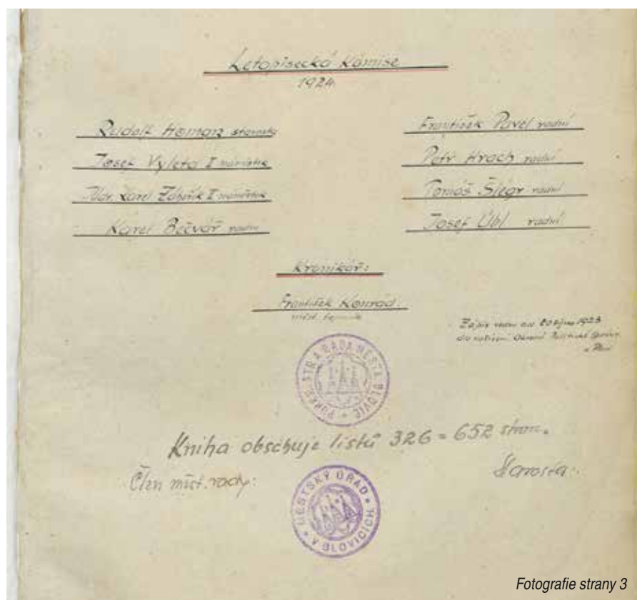
Fotografie strany 3