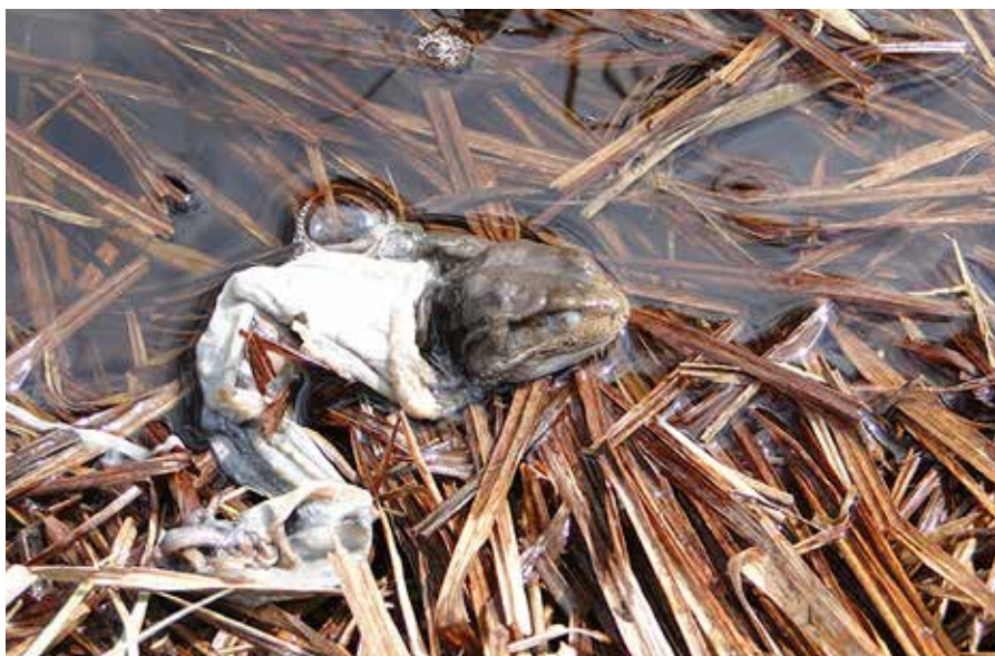
Obr. 5. Ropucha obecná dovedně svléknutá z kůže vydrou nebo norkem. Foto: P. Vlach, 2014