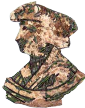
Část kachle s vyobrazením s největší pravděpodobností Ferdinanda I. Habsburského

Muž na kachli má na sobě dvorské oblečení, šubu a na hlavě baret, typ účesu vzhledem k poškození není bohužel možné určit. Kachel, původně zdobený zelenou glazurou, dnes poškozenou, je datován do 1. poloviny 16. století. Vynález kachlových kamen, v čes-