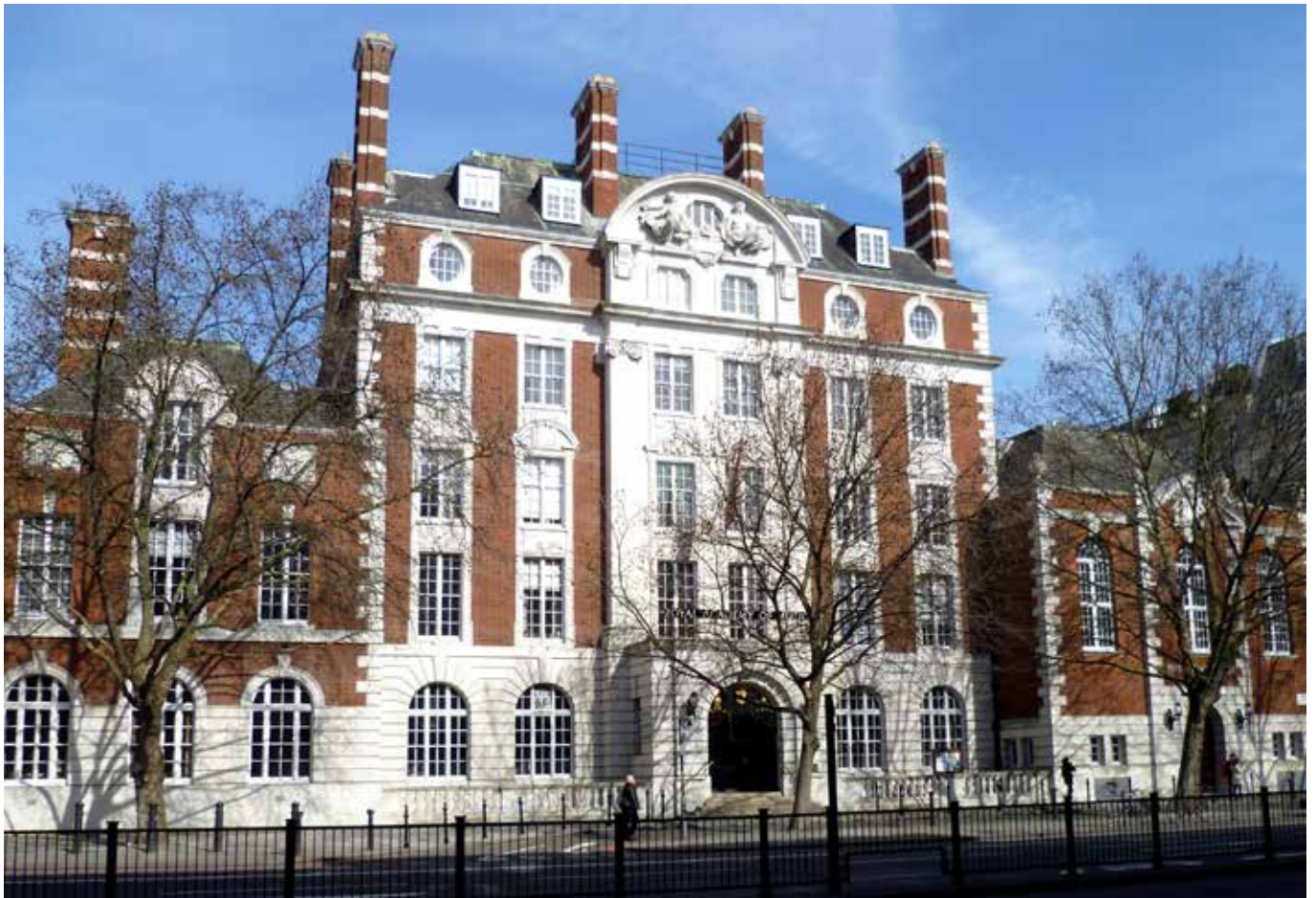
Královská akademie v Londýně