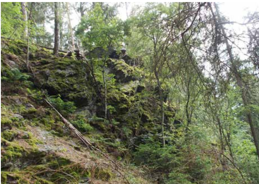
Vrchol 506 m