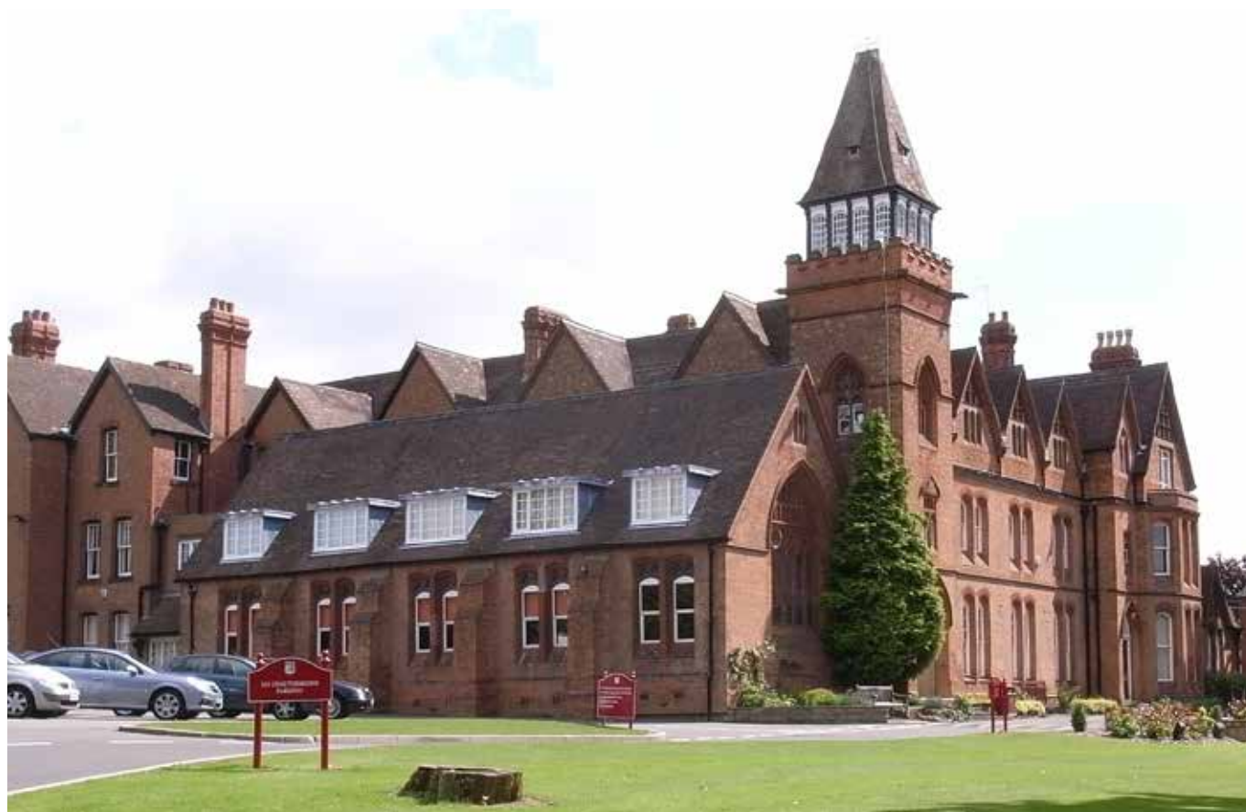
Střední škola může skutečně vypadat jako z Harryho Pottera (Solihull School)

Pokud se pokusíme vše shrnout a porovnat, je možné polemizovat o tom, že hudební výchova na českých základních školách a gymnáziích za tou britskou v mnohém zaostává. Ovšem pokud bychom ale chtěli porovnat instrumentální dovednosti a technickou vyspělost žáků na ZUŠ a konzervatořích, se svými britskými vrstevníky, jeví se český model už v mnohem lepším světle. Žáci mají od 6 let možnost individuálního vedení a plné pozornosti svého učitele. Náš systém je pro rodiče velmi levný, po celé republice široce dostupný a vyučují v něm velice kvalitní pedagogové.