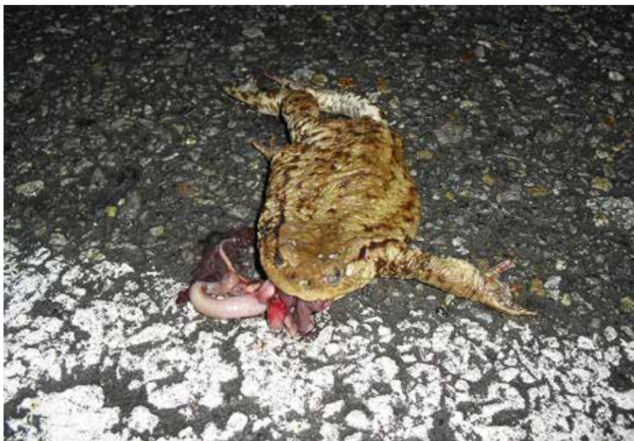
Obr. 3. Tento jedinec ropuchy obecné přes silnici evidentně nepřežl.

Zavadil V., Sádlo J., Vojar J. (eds.), 2011. Biotopy našich obojživelníků a jejich management. Metodika AOPK ČR, Praha, 178 pp.