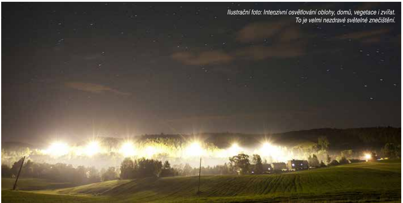
Ilustrační foto: Intenzivní osvětlování oblohy, domů, vegetace i zvířat. To je velmi nezdavé světelné znečištění.

Také ptáci jsou světelným znečištěním významně negativně ovlivněni. Migrace ptáků se odehrávají zásadně v noci a zmíněné dominanty oblohy, stejně jako krajinné obrysy používají k orientaci. Světelné znečištění hrozí záměnou těchto přirozených orientačních bodů a ptáci se prostě mohou ztratit. Dlouhé migrace ptáků bývají pro každý druh