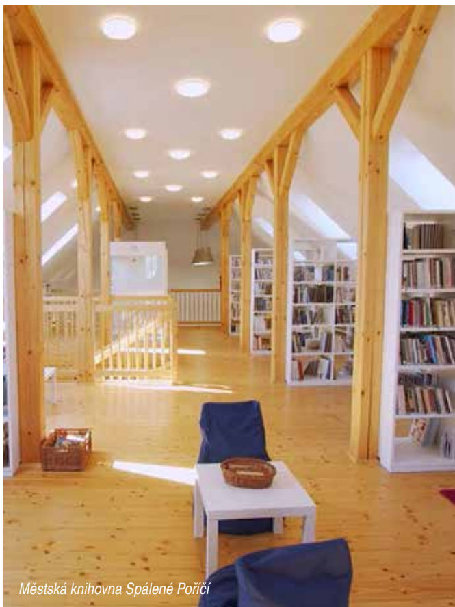
Městská knihovna Spálené Poříčí