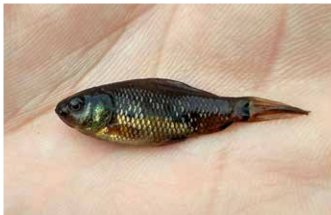
Mladý karas z „černého rybníka“ v cihelně

Cihelna je mocné místo; místo s výskytem mnoha zvláště chráněných druhů živočichů a rostlin, místo, kde se tu a tam prohání vojenská technika. Místo, kde mnoho z nás absolvovalo své první rande, kam se mládež z „horních“ Blovic léta chodila koupat a dala si zde tajně své