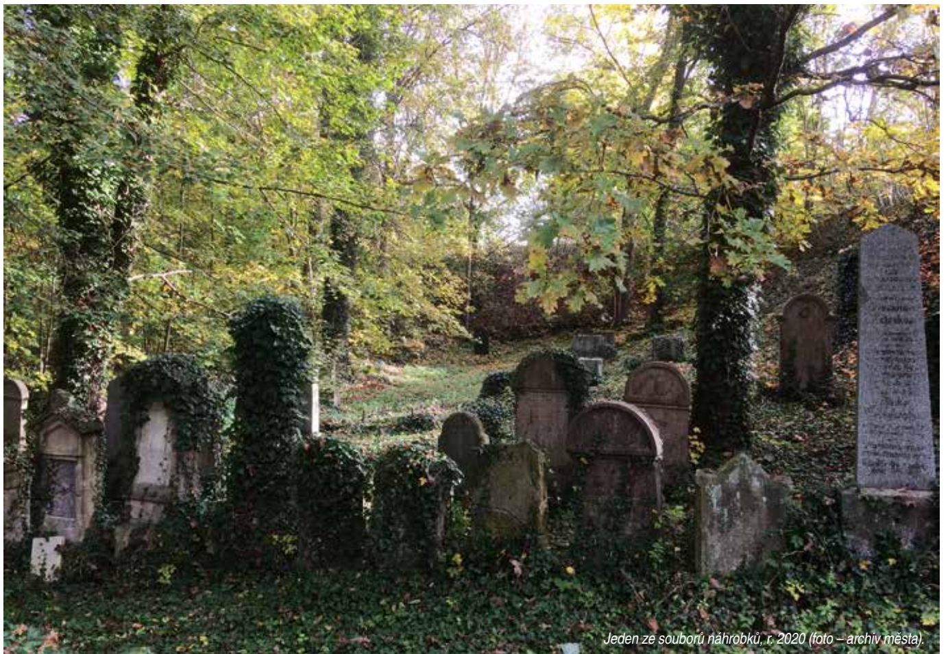
Jeden ze souborů náhrobků, r. 2020.