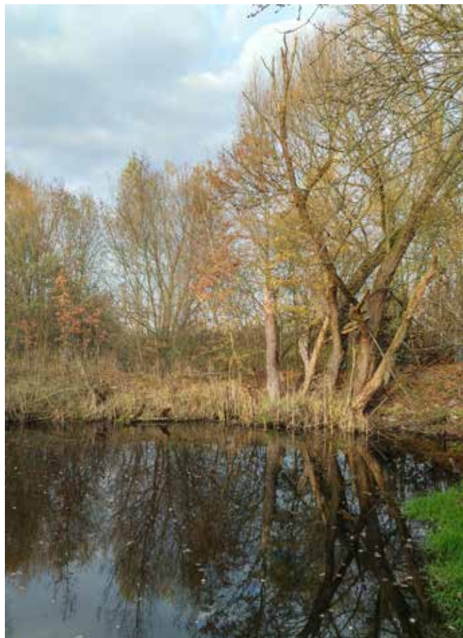
Eutrofní „černý rybník“ v cihelně patří mezi nejnižší body v lokalitě a je lemován řadou vzrostlých stromů. Bude jistě jedním z pilířů klidové zóny v nové cihelně.

Máme-li posoudit míru znečištění zkoumané lokality, je nutné porovnávat zjištěné hodnoty s limitními ukazateli uvedenými v nařízení vlády č. 401/2015 Sb., o ukazatelích a hodnotách přípustného znečištění povrchových vod a odpadních vod, náležitostí povolení k vypouštění odpadních vod do vod povrchových a do kanalizací a o citlivých oblastech. Uvedené limity jsou patrné v Příloze 3., v tabulkách 1A, 1B a 1C.