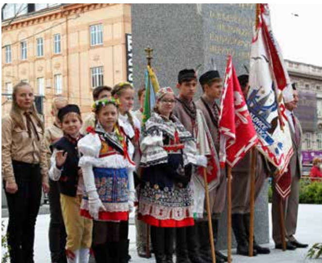
Slavnosti svobody Plzeň 2018 – u památníku Díky, Ameriko!