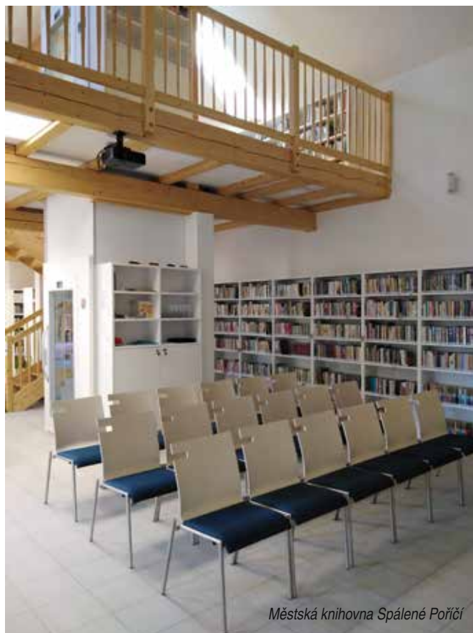
Městská knihovna Spálené Poříčí