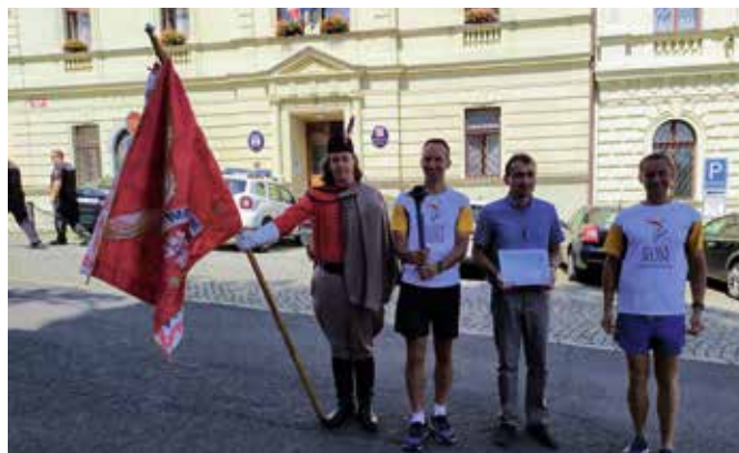
Pochodeň míru 2019 – blovické náměstí