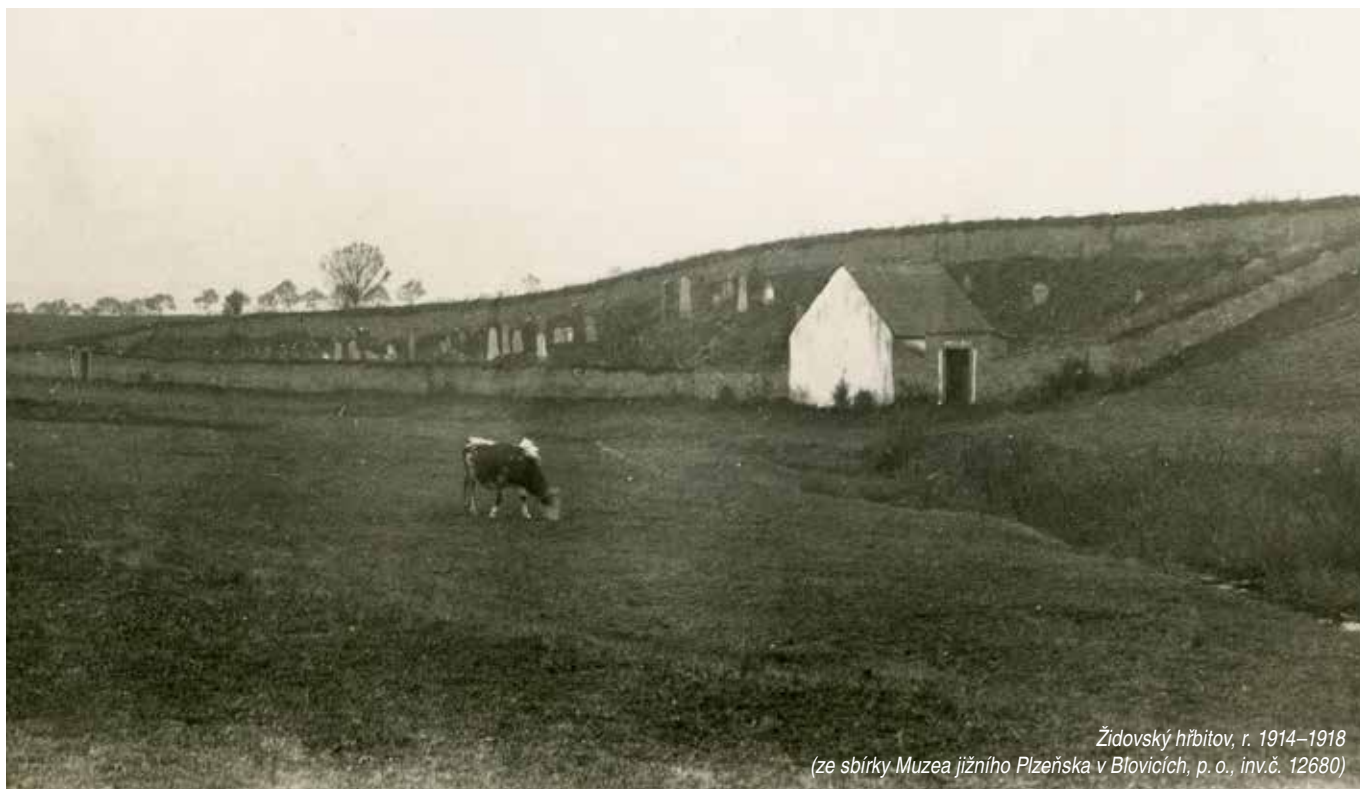
Židovský hřbitov, r. 1914–1918