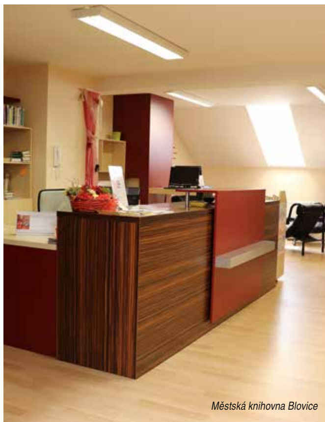
Městská knihovna Blovice