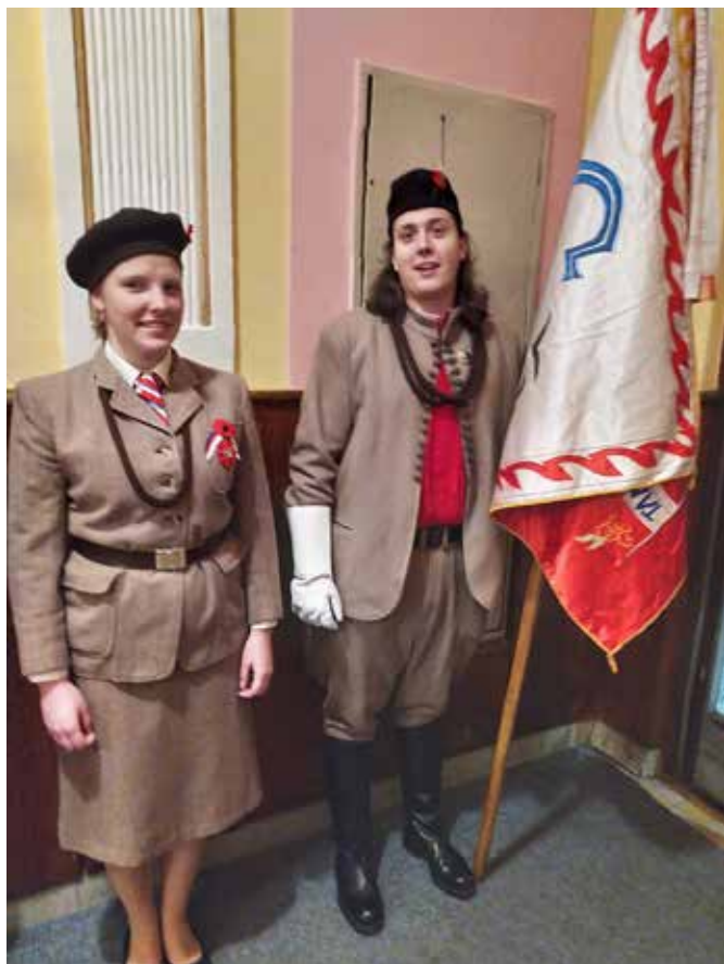
Ples župy Plzeňské 2018 – Městanská beseda Plzeň