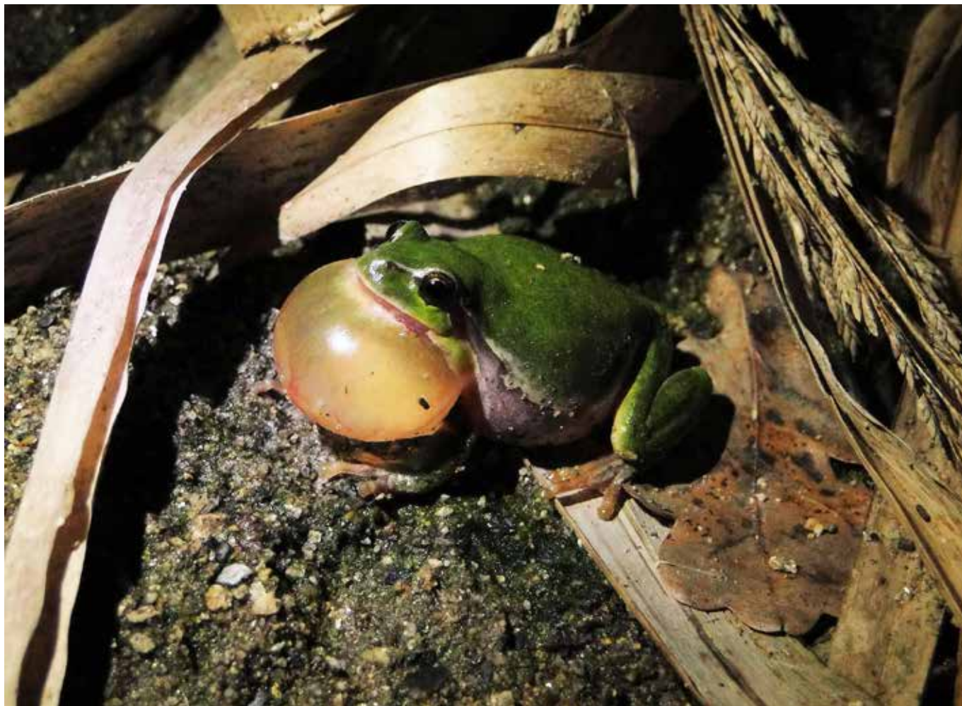
Rosnička zelená z Tábora. Foto: Pavel Vlach, 2010.