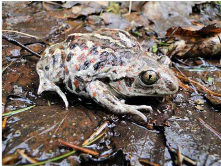
Blatnice skvrnitá z Bochova.