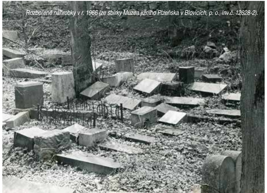
Rozbořené náhrobky v r. 1966 (ze sbírky Muzea jižního Plzeňska v Blovicích, p. o., inv.č. 12628-2).

Jakubec P., Rozkošná B. Židovské památky Čech. Vydavatelství ERA nebo ERA group spol. s r. o. Brno. 2004. ISBN 80-86517-64-0 Archiv města