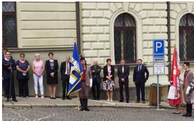
Stužkování vlajky 2020 – u příležitosti oslavy 100 let čs. vlajky – blovické náměstí