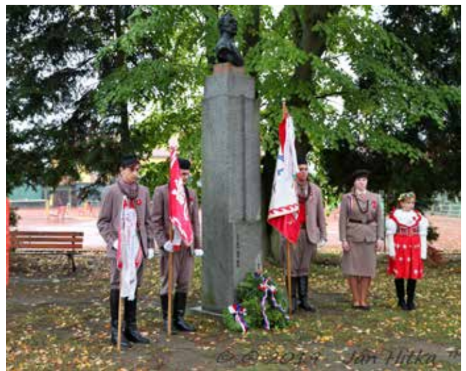
Památný den sokolstva 2019 – u památníku M. Tyrše v blovické sokolovně