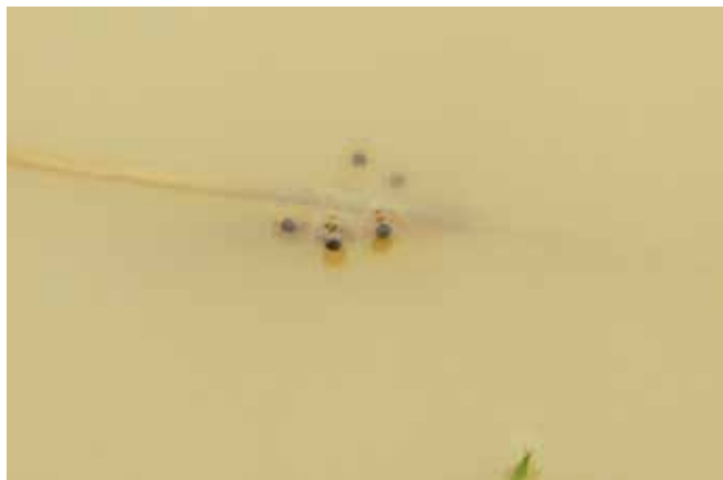
Kuňka žltobřichá v amplexu z cihelny (vlevo), snůška kuňky žltobřiché (vpravo).

Kuňka obecná (ohnivá) žije v nižších polohách, v trvalých zarostlých rybníčcích až velkých rybnících, ze kterých se ozývá jemným „hu-hu-hu“ (vzpomeňte na pověstnou scénu z filmu Na samotě u lesa: „Radíme, vyšší!“). Protože se oba druhy doplňují, kuňka žltobřichá žije spíše ve vyšších polohách, a to v drobných periodických tůňkách (historicky vyšlapávaných zvěří u napajedel), aktuálně tedy v biotopech, které nejsou přirozeně vytvářené a značně jich ubývá. Způsobu života má přizpůsobené i rozmnožování – nemůže se spolehnout na to, že drobná tůňka během 50 dní, kdy se vyvíjí pulci, nevyschne, proto neklade vajíčka najednou, ale v dávkách po cca 50 vajíčkách od jara do podzimu. Vajíčka lepí na vodní vegetaci v tůňkách, ve kterých žije. Hlas kuňky žltobřiché je naléhavější, vyšší, spíše rychlejší „hůůů-hůůů-hůůů“.