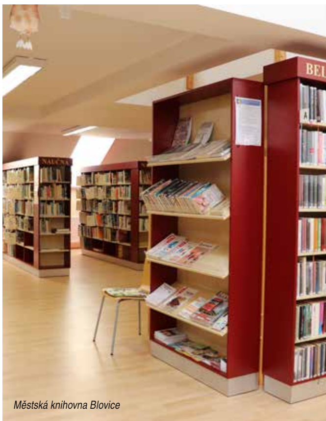
Městská knihovna Blovice

Městská knihovna informuje nejen své čtenáře, že od pátku 23. října, je jako ostatní knihovny v celé České republice do odvolání, uzavřena veřejnosti. Všechny půjčené knihy, jsou automaticky prodlouženy, bez poplatků z prodlžení, až do doby, kdy se knihovny opět otevřou. Děkujeme za pochopení.