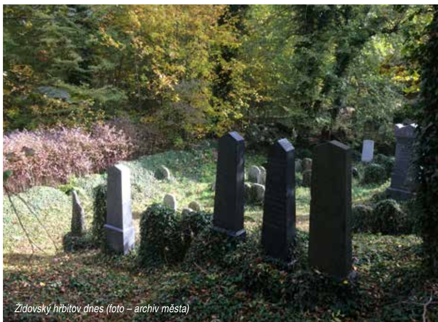
Židovský hřbitov dnes

První zmínka o židovském osídlení v Blovicích pochází z počátku 16. století po vysídlení Židů z Plzně v roce 1504. Od 17. století je v Blovicích doložena židovská náboženská obec jako samosprávná jednotka. Ani blovickým Židům se nevyhnula různá opatření a omezování, např. ze zmíněného Familiantského zákona zřejmě vycházelo i vyhlášení hraběte Prokopa Kolovrata z února 1747, v němž nařídil osmi židovským občanům, aby se i s ženami a dětmi do tří měsíců vystěhovali z hradíšťského panství. Problémy měli Židé i při rozšiřování svého hřbitova, když v září 1762 bez vědomí a svolení vrchnosti přikoupili od obce obecní půdu o výměře 30 loket za 30 zl. Byli odsouzeni k zaplacení pokuty 100 zl. a ti, kdo koupí domluvili, byli potrestáni třemi dny vězení. Podle zápisu v kronice jim po udělení milosti byla z tohoto trestu odpuštěna částka 50 zl. Na území našeho města nikdy nevznikla uzavřená ghetta, židovské domy byly od 18. století, kromě jednotlivých domů rozestých většinou poblíž náměstí, soustředěny zejména na dvou místech. Na západní straně náměstí byl např. rodný dům Adolfa Oppera de Blowitz, dům Radnitzerových a Ornsteinových a v dnešní ulici Za Spořitelnou pak několik dalších domů včetně židovské školy. Dalším přirozeným centrem blovických Židů byla dnešní Malá ulice, kde kromě několika židovských domů stála také synagoga. Jedná se o dům č. p. 205 (patrový