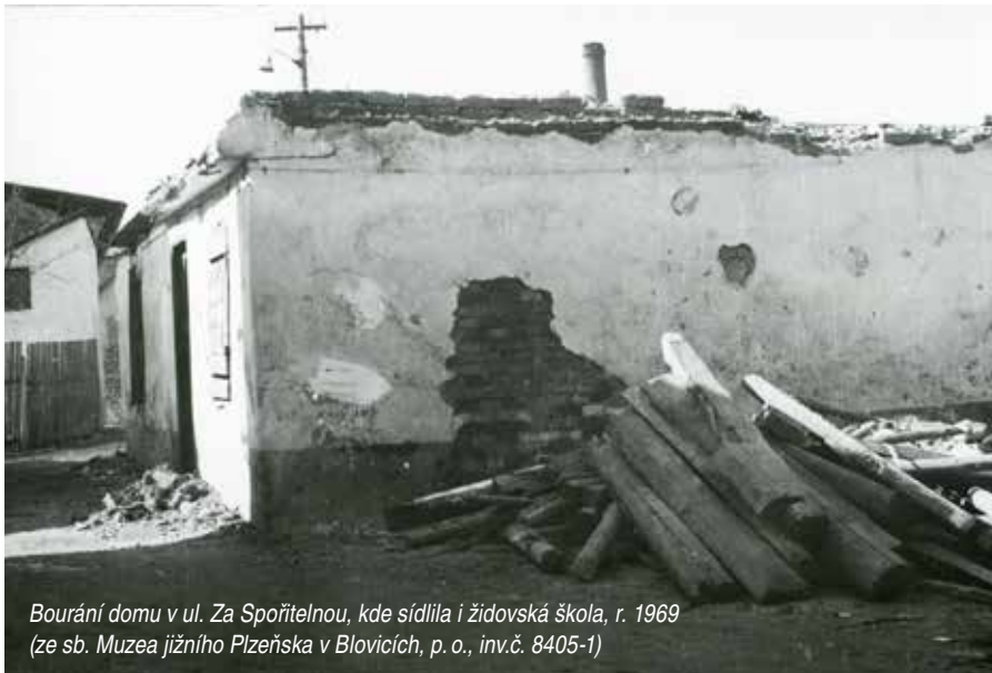
Bourání domu v ul. Za Spořitelnou, kde sídlila i židovská škola, r. 1969 (ze sb. Muzea jižního Plzeňska v Blovicích, p. o., inv.č. 8405-1)

dům naproti budově úřadu). Původně dřevěná synagoga, na kterou byl v roce 1683 upraven soukromý domek Krausových, byla nahrazena novou synagogou, vystavěnou v eklektickém slohu 1 v letech 1903 a 1904. Bohoslužebným účelům sloužila do nacistické okupace, po druhé světové válce byla postupně využívána jako městská knihovna, kanceláře a byty. Přesto, že synagoga během poválečných let zcela ztratila svoji původní podobu i využití, podařilo se současnému vlastníkovi při právě probíhající rekonstrukci domu zachránit a opravit žulové vstupní schodiště, vstupní dveře a krov. Stav rovněž dochované falešné klenby s ornamentální výzdobou byl ale bohužel v již tak špatném stavu, že musela být po předchozí dokumentaci sejmuta.