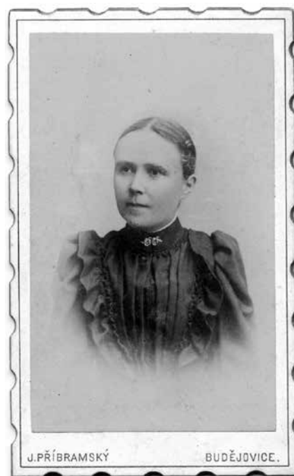
Fotografie Augusty Rozsypalové. (Archiv Muzea jižního Plzeňska v Blovicích)

20. století totiž strávila pro svůj nevšední vychovatelský a pedagogický talent 6 a půl roku na soukromém učitelském ústavu