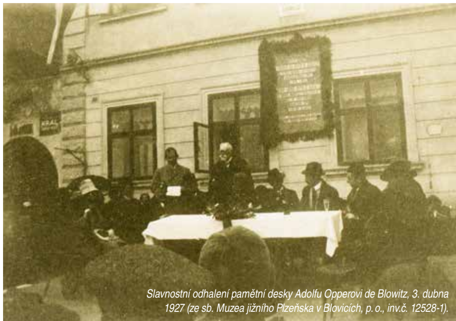
Slavnostní odhalení pamětní desky Adolfu Oppperovi de Blowitz, 3. dubna 1927 (ze sb. Muzea jižního Plzeňska v Blovicích, p. o., inv.č. 12528-1).