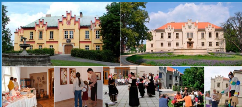
Muzeum otevřeno: úterý – pátek 9 – 15 hodin; 28. 10. 2012 (Den krajů) 10 – 16 hodin.

10 LET MUZEA NA ZÁMKU HRADIŠTĚ 4. 10. 2012 – 6. 1. 2013