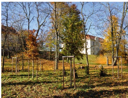
fyotodokumentace zámeckého parku s novou výsadbou autorka D. Sýmáčová