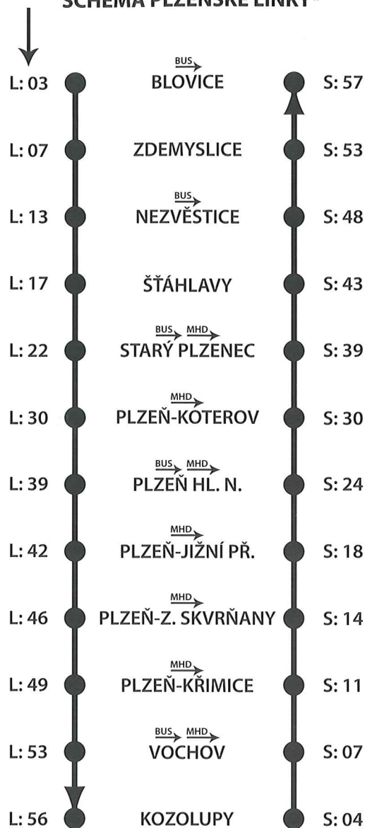
SCHÉMA PLZEŇSKÉ LINKY*

Plzeňská linka tak přinese kvalitní dopravu pro satelity v blízkém okolí města Plzně s možností přepravy v rámci města Plzně po železnici bez přestupu na hlavním nádraží. Plzeňská linka bude zařazena do systému Integrované dopravy Plzeňska . Rozšíří se tak počet vlakových spojů, na kterých budou moci cestující využívat předplatné na Plzeňské kartě .